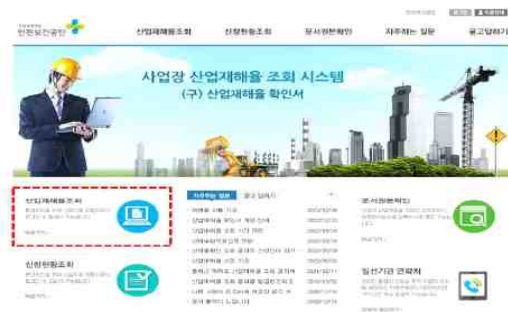
사업장 산업재해를 조회 시스템 ( https://certi.kosha.or.kr )